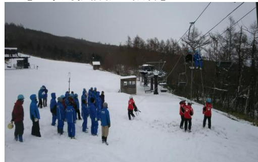
【予備原動機切替訓練】