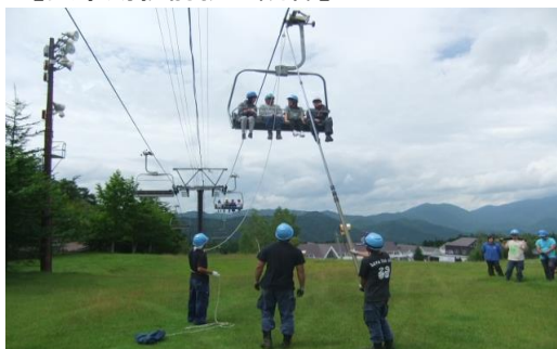
【消防合同救助訓練】